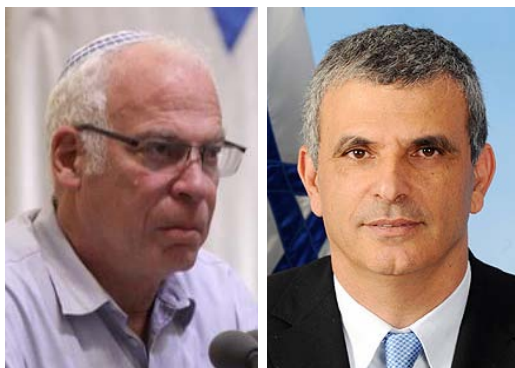
שר האוצר משה כחלון | שר החקלאות אורי אריאל

אושרו פוליסות לחקלאים בסך 16 מיליון שקל לביטוח נגד גניבה והשמדה של יבולים מבתי אריזה, גניבות בקר וגניבות צאן. משרד החקלאות ומשרד האוצר קידמו את הנושא על מנת שחקלאים יוכלו להתמודד כלכלית הפסדים של גניבות ויקבלו כיסוי ביטוחי. נמסר כי משנת 2017, שר החקלאות אורי אריאל קידם מול משרד האוצר את הפוליסות על מנת להיטיב עם החקלאים אשר נפגעו בעקבות פשיעה חקלאית. הפוליסות, יפעלו דרך הקנ"ט (הקרן לנזקי טבע) וישירות לחקלאים. התקציב יופנה לטובת סבסוד פרמיות ביטוח במסגרת תקציב מיוחד שינתן לקרן לנזקי טבע, חברת הביטוח הממשלתית.